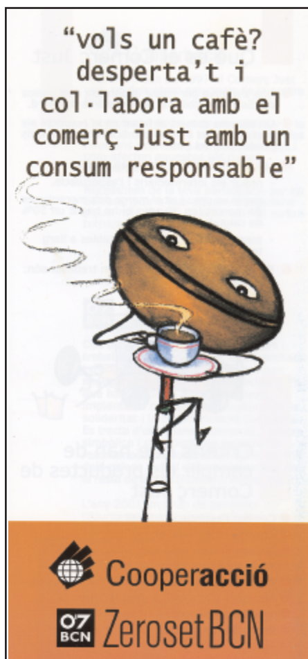
Coberta del tríptic de Cooperació i ZeroseBCN per la campanya de promoció del comerç just

Tal com s'ha comentat ZeroseBCN està col·laborant amb Cooperació per a la realització del projecte “Introducció de cacau i sucre de comerç just al sector del venedor a Barcelona”. Durant els 6 primers mesos de l'any 2005 s'han preparat els tríptics a repartir (vegeu tríptic adjunt) i s'ha fet la primera distribució d'aquest tríptic i del tríptic de ZeroseBCN a l'Hospital del Mar i a la Casa Gran. Després de l'estiu es farà a d'altres punts de l'Ajuntament.